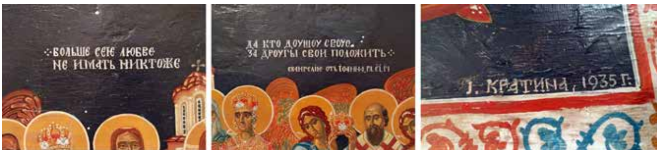
Сл.2 – (а) Детали од испишаниот текст во горната половина(по извршената конзервација); (б) Детал од сигнатурата на авторот и годината

вање зелена боја, како и тонски произведени од мешање со белата боја, за осветлување. Одеждите се изведувани со многу внимание кон деталот, особено во декоративните елементи, како круна, текстури, украсни ленти и сл, а крајната бордурна сликана рамка, од композицијата, е украсувана со флорален мотив, што се репетира во црвена и