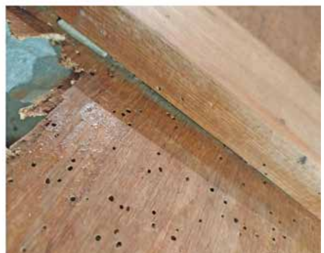
Сл.4 – Во тек на конзерваторскиот третман: (а) -Прилепување на заштитна хартија од предна страна; (б) Импрегнација на дрвениот шпер од задната страна, (в) – Уцврстување на рабовите од дрвената подолога на местата на отпаднатите лакуни и прилепување на дрвените летви на местата на нивните одвојувања