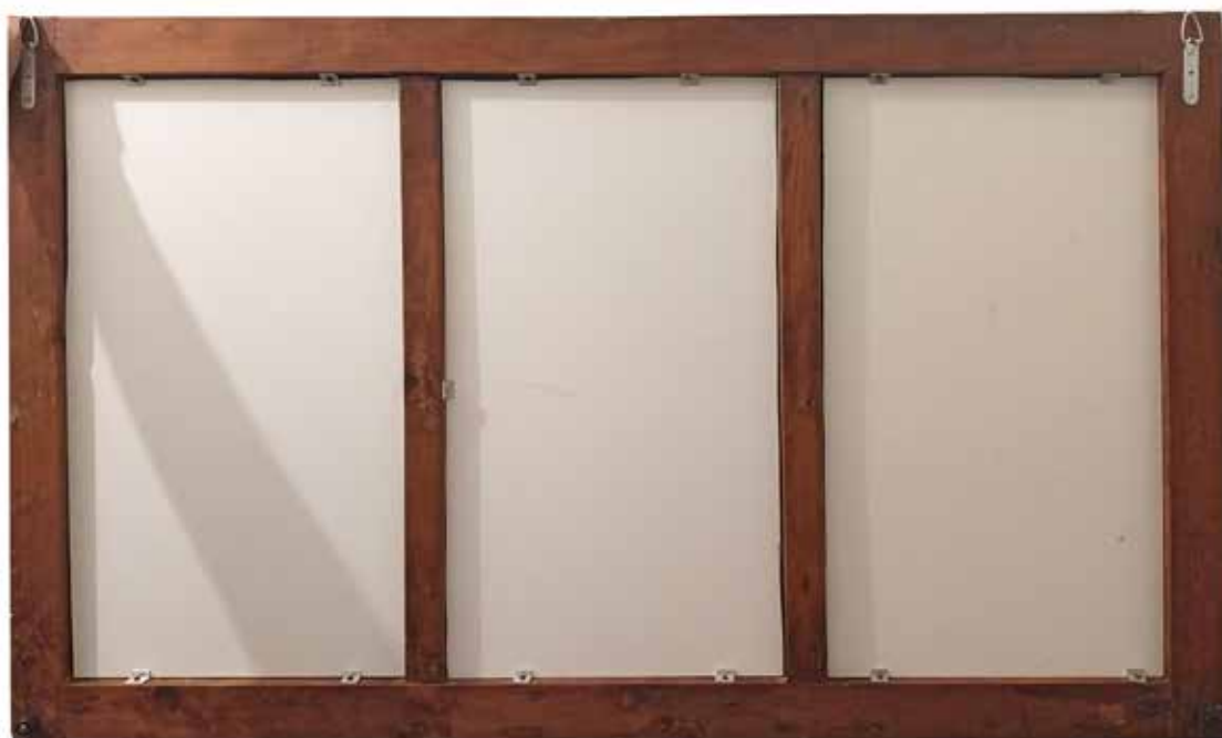
Сл.9 – По извршениот конзерваторски третман и изведен ретуши (предна/задна страна)