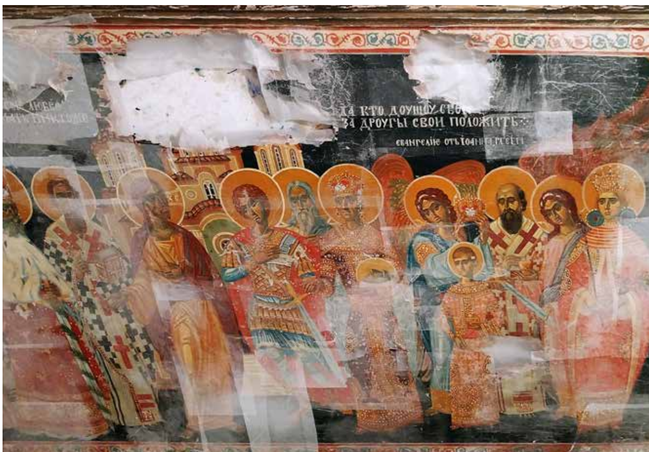
Сл.4 – Во тек на конзерваторскиот третман: (а) - Прилепување на заштитна хартија од предна страна;

сока, онаму каде што пристапноста да се дејствува во внатрешното ткиво на дрвената шперплоча, односно помеѓу горниот и долен дрвен слој, во неговата средина -пределот на дрвените струготици, освен што се дејствуваше со инјектирање за укрутување, се додаваше и дрвен кит како полнило, за подигнување на потонатите места и исполнување на празнините предизвикани од гнилежот со евидентна црвоточна прашина.