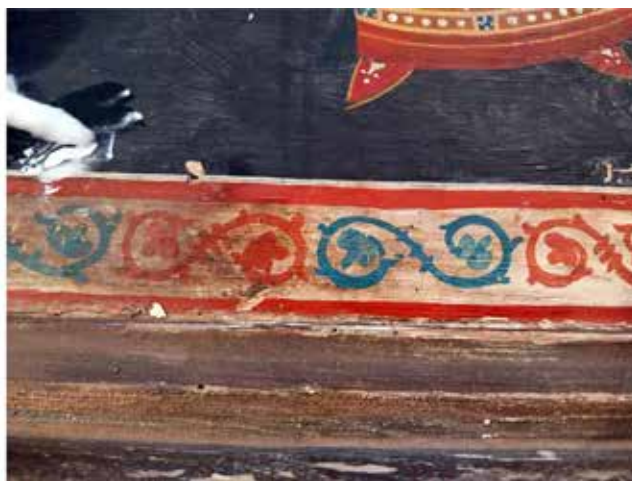
Сл.3 – (а) Детал од надворешниот рам и (б) Детал од деградираниот лак на иконописот

златен пигмент. На места, евидентирана е скрама од заштитен лак, а целата површина од предна страна беше делимично пожелтена и со површински нечистотии (Сл.3-б).