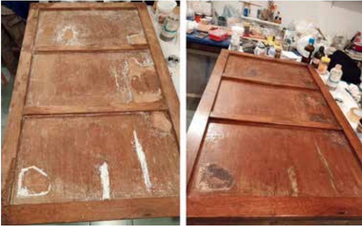
Сл.8 – Третмани на задната страна: (а) – Пополнување со дрвен кит на местата на деловите кои недостасуваа и пополнување со бела конзерваторска подлога во црвочните дупчиња; (б) – Премачкување со заштитен лак