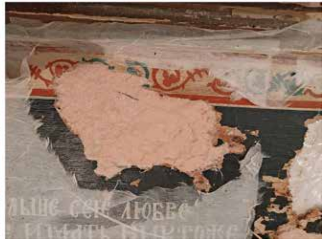
Сл.6 – Поставување на точната локација на отпаднатите делови врз подлога од дрвен кит

вање на лепилото (Сл.6). По сушењето на слојот од дрвен кит, на истите места беше нанесена белата конзерваторска подлога, а за нејзина нивелација се користеше плутана тапа и жолчка од јајце во раствор од дестилирана вода (1:12). (Сл.7-б). Исто така пополнувани се и контактните граници од фрагментите, како и местата на отпадната подлога од иконописот и деловите од големиот рам.