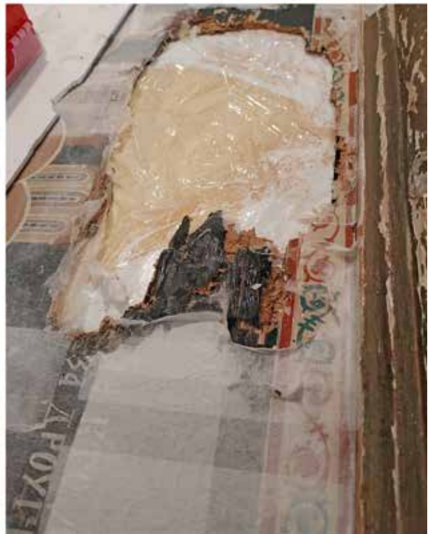
Сл.5 – (а) Задната страна: Поставување на мелинекс на местата од отпаднатите делови (б) Детали од предна страна: поставувањето на фрагментите на точните локации по поставувањето на мелинексот од долната страна